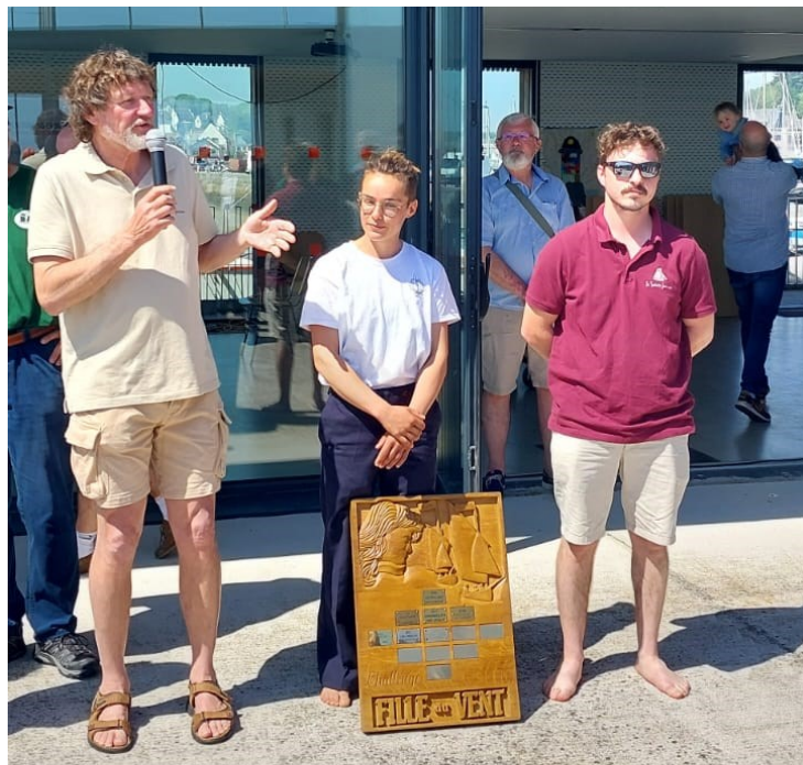
Remise du trophée du challenge « Fille du vent »