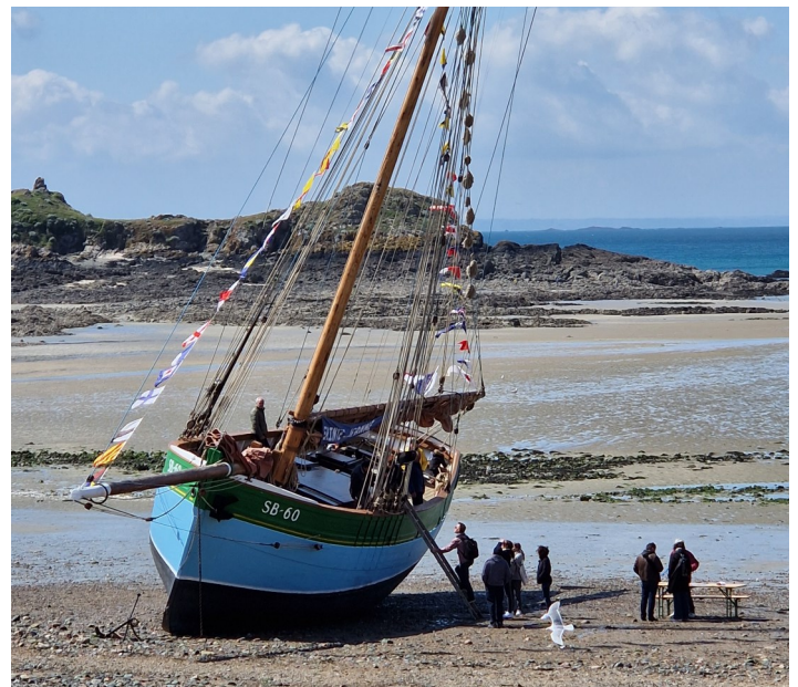
La Sainte Jeanne échouée sur la plage du port pour le pont ouvert du vide grenier

Pour cela, nous avons eu la chance d'être relayés par 2 reportages des chaînes télé TF1 et FR3, des articles dans la presse, une campagne d'affichage, le pont ouvert du vide grenier, la dynamisation de la page Facebook, l'activité des permanents de l'Escale.