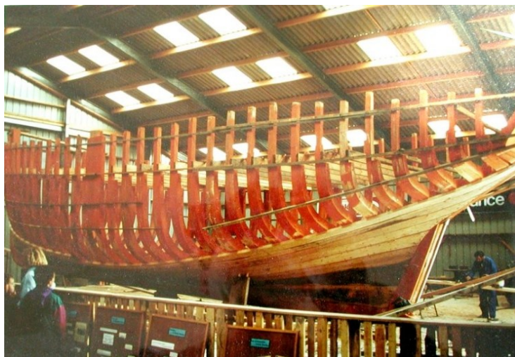
Il y a 30 ans : la Sainte Jeanne

Nous aurons besoin de bonnes volontés pour nous aider (restauration, montage et démontage de barnums ...) pendant ce weekend festif, si vous souhaitez y participer, contactez-nous.