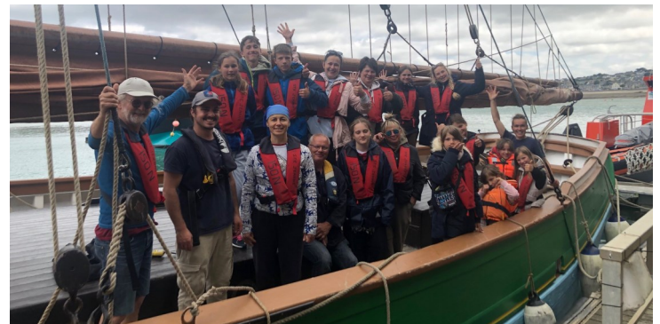
A la découverte de la Sainte Jeanne