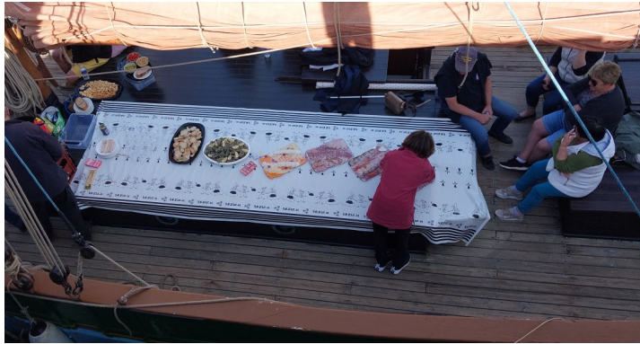
Préparation d'une privatisation du bateau à quai pour un apéritif

L'autre satisfaction de ce début de saison est d'avoir su nous diversifier pour nous adresser à un public allant de particuliers à entreprises, sans oublier différents organismes sociaux qui ont répondu largement présents : 2 croisières sur 2 week-ends en juin, privatisations d'une 1/2 journée ou d'une journée avec ou sans restauration pour entre autre une association qui gèrent des centres d'éducatifs spécialisés, un groupe industriel pour une sortie des collaborateurs dans le cadre d'un séminaire, des entreprises artisanales pour des sorties détente du