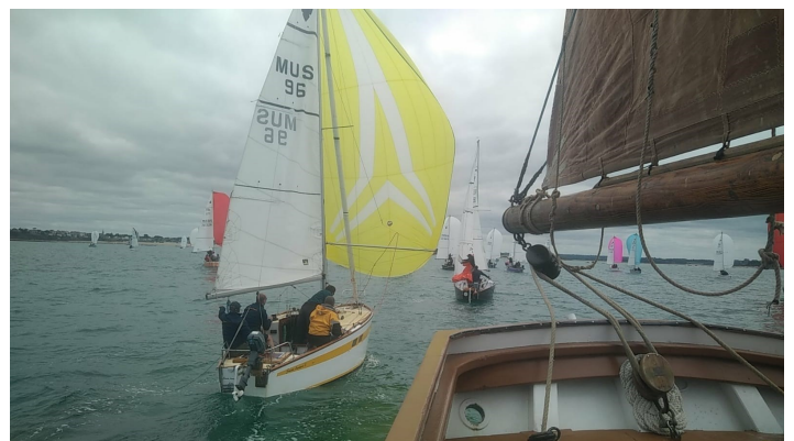
Rencontre inopinée : au milieu d'une course de vauriens

Et je ne peux pas me retenir de partager le deuxième coup de cœur : la marée est trop basse pour aller jusqu'à Saint-Jacut-de-la-Mer, on mouille avant de débarquer en annexe pour aller se balader, quand une régata décide que