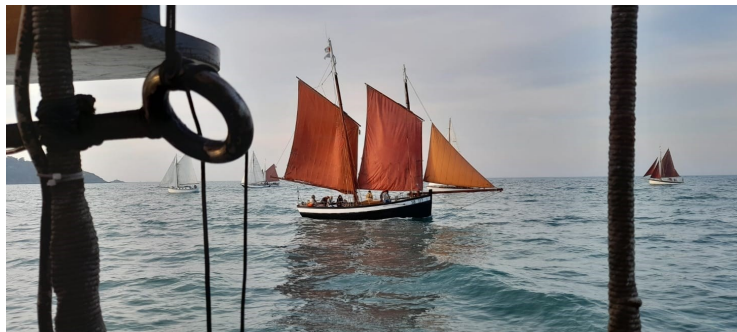
La parade devant Binic avec la Pauline

Toutes les voiles sont déployées mais Eole est resté confiné et la propulsion est malheureusement grandement assurée par le moteur qui compense la déficience des forces du zéphir. Le spectacle est néanmoins magnifique et suivi par de nombreux spectateurs massés sur le môle d'entrée du port auprès duquel les vieux gréements viennent tirer des bords.