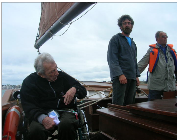
Le vieux marin sur le pont de la Sainte Jeanne pour sa dernière sortie en mer en août 2010