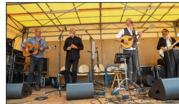
Deux jours de concert