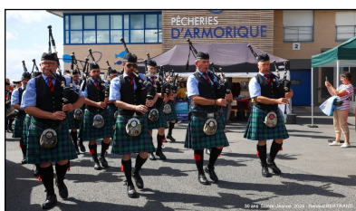
Déambulation de bagadou

Finalement, avec les efforts de nombreuses personnes la fête a débuté. Nous avons reçu le concours d'un nombre important de bénévoles non adhérents à l'association, merci à eux et elles.