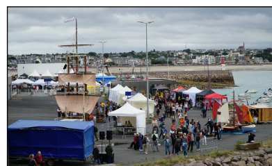
Des exposants et des animations